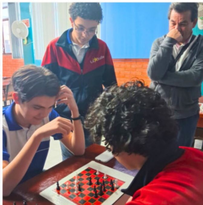
Alumnos de bachillerato en torneo de ajedrez.