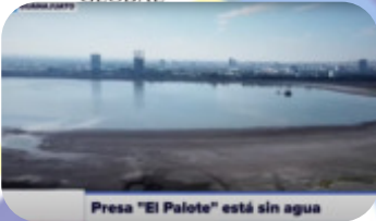
Presas "El Palote" está sin agua