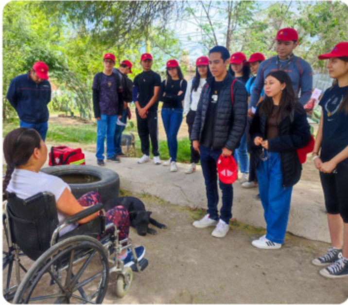
Foto: alumnos de misión.